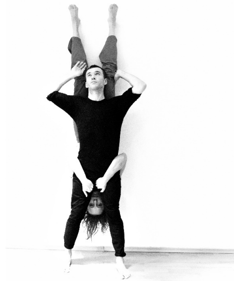
Image 4 – Composition au mur, par Julia Lewandowska et Konrad Kozior. Photo: Rafal Skwarek (2020).

La composition ne s'élabore qu'au fil des découvertes physiques, qui passent par des prises de risques de plus en plus importantes, variables selon les binômes. Les partenaires les plus en confiance travaillent en silence et découvrent par l'épreuve physique ce que les corps peuvent construire ensemble; ceux qui rencontrent des peurs, hésitent à prendre des risques et utilisent le dialogue verbal pour élaborer mentalement une composition qui