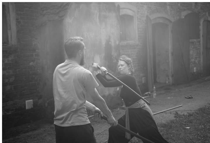
Image 2 – Entraînement au bokken , Summerclass 2020, Brzezinka, Pologne.