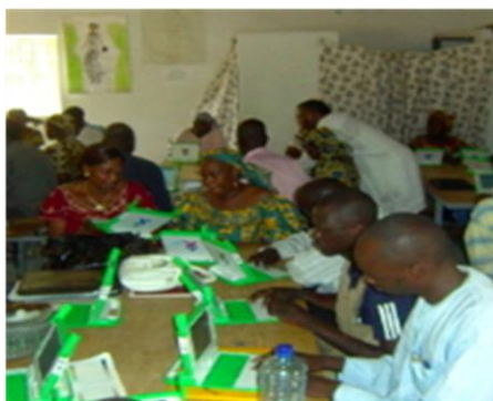
Session de formation des enseignants aux TIC

Afin de permettre aux instituteurs acquérir les compétences en informatique, une demande d'assistance technique a été adressée à l'UNESCO par le MINEDUB. Ce volet se déroule en deux phases : une phase pilote dite d'expérimentation et une phase de généralisation.