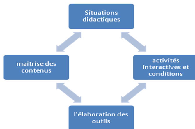
Schéma 1: les 4 conditions de l' intervention didactique

Cette intervention didactique porte sur un objet d'enseignement qui est ici l'informatique.