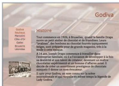
Figure 2: Un travail qui demande peu de temps à celui qui est organisé

Le texte descriptif est en police Cambria, corps 18 pt.