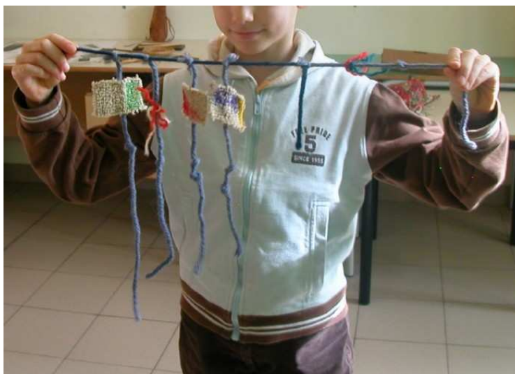
Figure 4. Réalisation d’un quipu pour coder des informations non-numériques

Il s’agit ici d’une façon très curieuse de coder l’information, à la fois numérique et non-numérique, qui témoigne de la variété des systèmes de codage. Les enfants apprennent les règles pour organiser nœuds et ficelles selon une syntaxe complexe (figure 4), où les « différentes parties de l’instrument d’enregistrement quipu interagissent entre elles pour constituer ce que l’on pourrait appeler le codage ASCII du système d’informations quipu » (Urton, 2003, pp. 39-40). Contrairement aux artefacts vus précédemment, il est intéressant de remarquer que c’est la position des signes (nœuds) qui permet de déterminer la valeur représentée — d’où les élèves sont conduits à reconnaître la nécessité d’une notation pour le chiffre zéro.