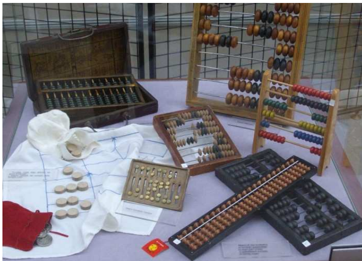
Figure 6. Les nombres sont représentés de façon différente dans différents types de bouliers

À la fin du parcours, l'occasion se présente aux enfants de manier une variété d'instruments de calcul (figure 6), comme par exemple quelques bouliers (stchoty, suanpan, soroban) ou les bâtons de Neper, ce qui leur devrait permettre de concevoir l'idée de machine à calculer (voir aussi : Williams, 1997).