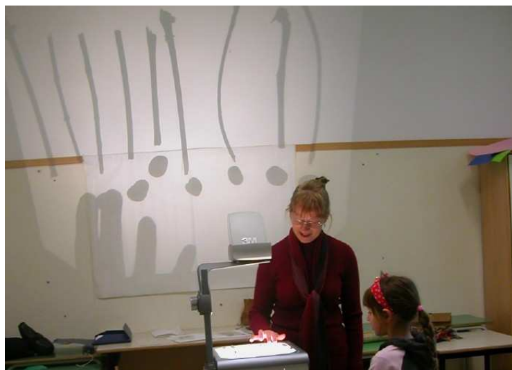
Figure 1. La correspondance biunivoque est à la base de l'abstraction des nombres

La correspondance biunivoque (figure 1) et la nature conventionnelle des formes de codage de l'information font l'objet de cette unité. Pendant que les enfants s'amuse à inventer (conventionnalité) et à appliquer leurs propres codes à l'imitation des peuples décrits par les anthropologues, ils exercent en même temps la coordination des fonctions sensori-motrices et de verbalisation. Comme le remarque justement Vergnaud (2002), il s'agit d'établir une « correspondance biunivoque entre quatre catégories distinctes d'éléments : les objets à dénombrer, les gestes du bras et de la main, les gestes du regard, les gestes de la parole » (p. 12) — sur le sujet voir aussi Leconte & Camos (2004).