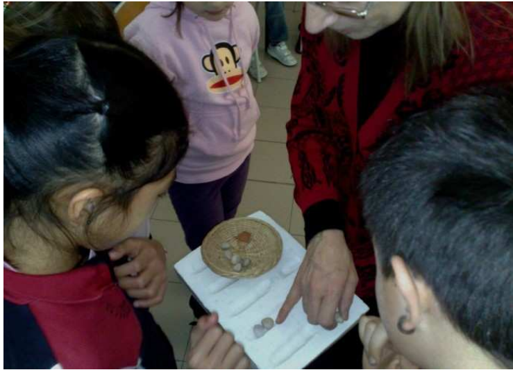
Figure 5. Travail avec l'abaque romain pour mieux comprendre la notation positionnelle

même temps, les enfants apprennent à exploiter l'abaque romain (figure 5) et à mettre en relation la disposition des galets avec les chiffres dans l'écriture positionnelle courante. Ainsi, la pratique d'établir des correspondances entre structures (représentationnelles) différentes qui font référence à la même entité contribue à développer les capacités d'abstraction des élèves.