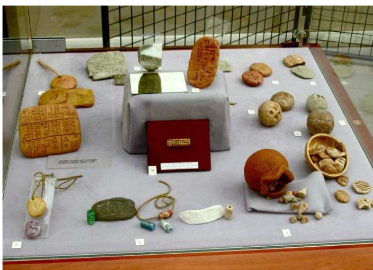
Figure 3. Artefacts mésopotamiens en argile pour le traitement d'informations

En Mésopotamie, l'utilisation des cailloux évolue vers un système plus complexe de jetons d'argile (figure 3) qui conduira à la transition du nombre concret au nombre abstrait. « La première singularité des jetons, c'est qu'ils étaient entièrement réalisés par l'homme [...] avec le seul but de communication et comptabilité. [...] En effet, le système de jetons fut [...] le système des signes le plus ancien [...]. On peut supposer que les jetons furent utilisés selon une syntaxe rudimentaire » (Schmandt-Besserat, 1996, pp. 93-94). Après avoir reproduit des jetons d'argile, les élèves jouent à un imaginaire « marché d'Ur » et ils sont amenés par les enseignants à reconnaître les propriétés opérationnelles des représentations de l'information (facilité de manipulation).