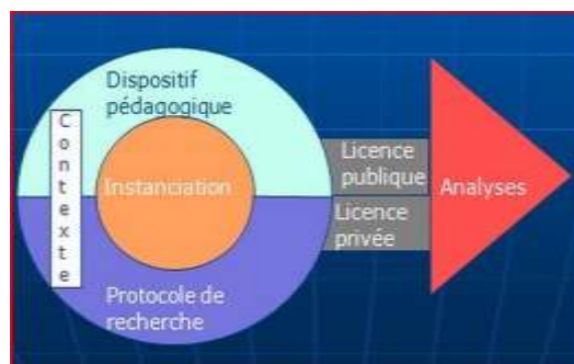
FIGURE 1 - Schéma des composants d'un corpus d'apprentissage (Mulce- documentation, 2011)