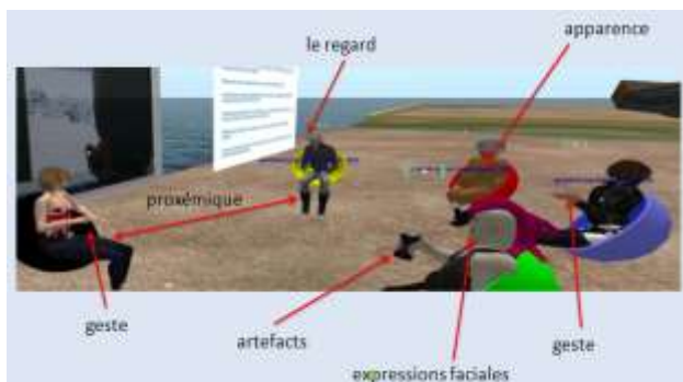
FIGURE 2 – Modalités de communication

Le recueil nécessite également la présence d'un avatar dans le monde synthétique pour capter les interactions. Bayle et Foucher (2011) soulignent les avantages et les contraintes générées par le choix d'avoir soit un avatar-chercheur présent dans le monde synthétique, soit de capter les données à partir des écrans des participants dans la formation. En ce qui nous concerne, dans les formations Building Fragile Spaces et Slic , nous avons opté pour le choix d'un avatar-chercheur. Pour diminuer l'impact potentiel de "l'observation participante" (Blanchet, 2011) sur les dynamiques entre participants (cf. "le paradoxe de l'observateur", Labov, 1972 :209), nous avons choisi un avatar dont la forme était celle d'un petit animal (figure 3) pensant que les étudiants adresseraient moins la parole à un avatar non-morphologique (cf. Wigham et Chanier, à paraître-b) et de ce fait que le chercheur serait aussi discret que possible.