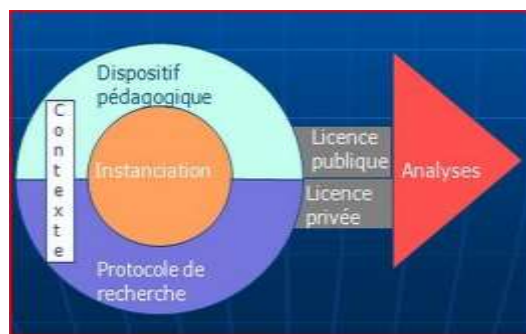
FIGURE 1 - Schéma des composants d'un corpus d'apprentissage (Mulce- documentation, 2011)