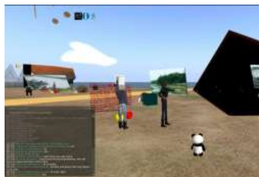
FIGURE 3 - L'avatar-chercheur

Avant les formations, dans le protocole de recherche, nous avons décrit la façon dont le chercheur allait positionner son avatar, en le plaçant à un endroit où il est possible de capter un maximum d'éléments. C'est primordial car le clavardage public n'apparaît que dans la fenêtre de clavardage des avatars qui sont à 20 mètres autour de la personne qui communique et l'audio public ne peut être entendu que par les avatars à 60 mètres de l'interlocuteur. L'avatar-chercheur a procédé à des enregistrements des séances en utilisant des logiciels d'enregistrement vidéo d'écran : Fraps (Beep, 2012) et Camtasia (TechSmith Corporation, 2010). Le compte de l'avatar-chercheur dans le monde synthétique a également été paramétré pour enregistrer le clavardage en texte brut.