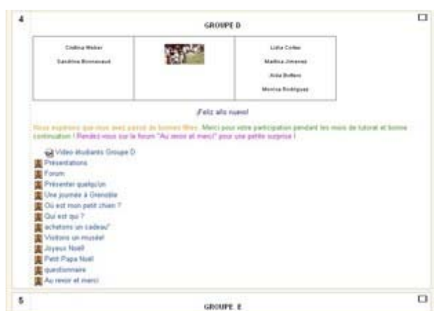
Figure 1 - L'espace du groupe D (les noms ont été modifiés).