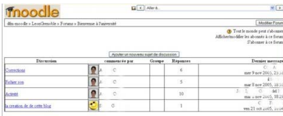
Figure 2 - Les sujets de discussion à l'entrée dans un forum.