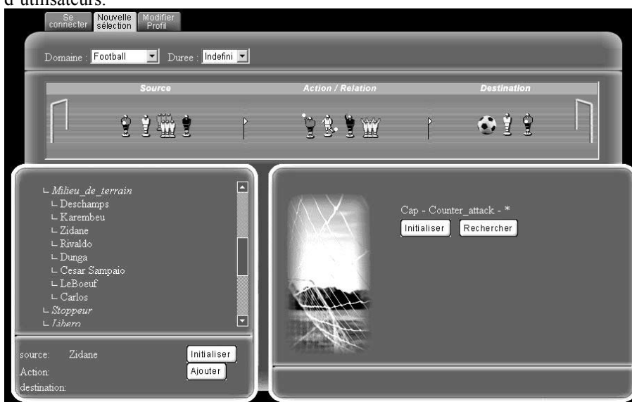
Figure 2 : Interface pour l'indexation ou l'expression des préférences TV

Dans ce but nous avons utilisé les mêmes formalismes que pour la conception de dispositifs pédagogiques, avec pour base la construction de CSV et l'usage d'ontologies. Le moteur de composition opère cependant avec des algorithmes différents. En ce qui concerne la spécificité de l'indexation pour des fragments TV ou pour de la musique, il est apparu une difficulté majeure. Il nous faut pouvoir proposer une interface d'indexation pour un indexeur humain, ou une interface d'expression des préférences pour un téléspectateur ou un auditeur 17 , qui soit ludique, tout en respectant le principe de la construction de CSV à partir d'une ontologie. Nous avons étudié plusieurs solutions. Nous présentons ici un exemple de l'interface utilisateur pour l'expression des préférences de l'utilisateur final. L'ontologie sélectionnée ("Domaine") est celle du football (en haut, à gauche). Les termes de l'ontologie sont le mieux possible représentés par de petites icônes (en haut) qui, sélectionnées, renvoient à des sous-arbres de l'ontologie (fenêtre en bas à gauche) et à des contraintes sémantiques exprimées par des triplets. Ici, la phrase "le capitaine contre attaque" a été sélectionnée par navigation dans les icônes et les sous-arbres (fenêtre en bas à droite). Le poids n'est pas pour l'instant pris en compte. Il fera l'objet d'une fonction d'apprentissage en liaison avec des stéréotypes d'utilisateurs.