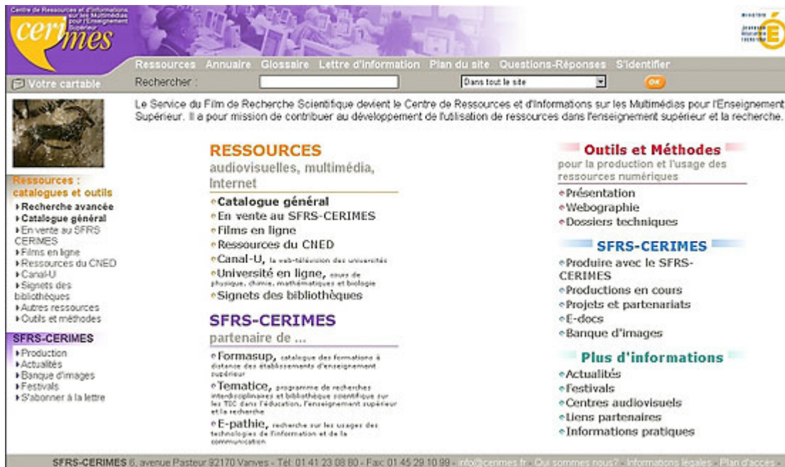
Figure 4 - Nouvelle présentation du site SFRS / CERIMES.

C'est, comme le dit Jeanneret ([Jeanneret00] : 113) un "portail [organisé] en une série de cadres contenant des listes [et] renvoyant à la "mosaïque de la presse"". Des éléments tels que la coloration différente pour indiquer la succession des rubriques, les logos institutionnels qui figurent sur la partie haute de la page, les coordonnées du SFRS / CERIMES disponibles d'entrée dans le site créent dans un premier temps l'image d'une information facile à repérer, légitime et légitimée, et d'un organisme ouvert à tout contact. Les deux éléments saillants (en lettres capitales de gros caractères) de cette nouvelle page d'accueil sont d'une part, la mise en avant de l'institution "SFRS / CERIMES" (mentions répétées), et d'autre part, l'entrée « RESSOURCES », qui renvoie, comme on va le voir, à un formatage de l'information. Enfin, l'illustration impressionniste en bandeau nous fait pénétrer dans une salle infinie « habitée » par des personnes « happées » par l'idéal du savoir défilant sur leurs écrans et livrés tout entières au mode de communication généré par « des tuyaux ». Le message idéologique est toujours sous-tendu par l'imaginaire de l'Internet [Flichy01]. Ce site propose un moteur de recherche unique, pour toutes les ressources, à partir d'entrées standardisées définies suivant des champs de requête documentaires (mots du titre, distributeur, année de production, support, type de document, etc.) et non pas pédagogiques.