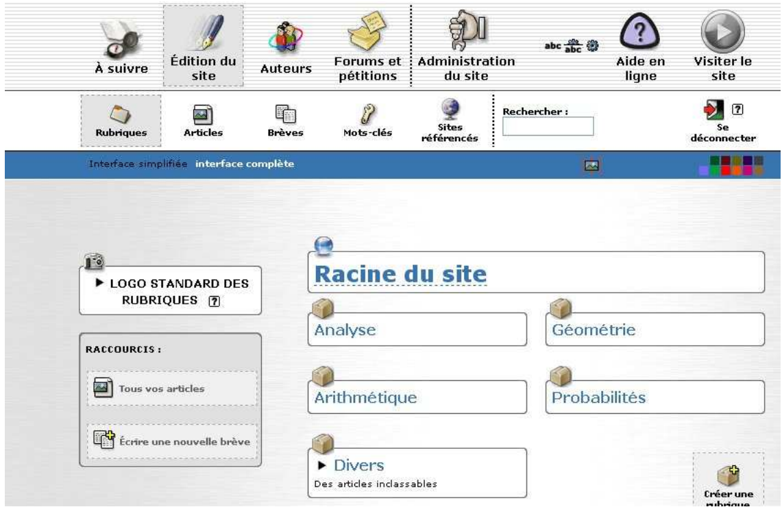
FIG. 3 – L'interface de rédaction des articles d'IREM2

Après une année de mise en place, IREM2 est maintenant fonctionnel et devrait rentrer en phase d'activité dès la rentrée prochaine.