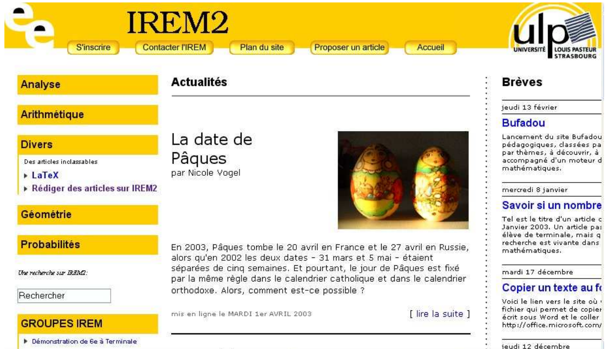
FIG. 2 – La première page d'IREM2

de développeurs solide, ce qui assure la pérennité du logiciel. De nombreux sites l'utilisent (entre autres celui du monde diplomatique http://www.monde-diplomatique.fr ). SPIP est assez facile à paramétrer et, contrairement à d'autres interfaces de gestion de contenu, laisse le champ libre au niveau du design final du site.