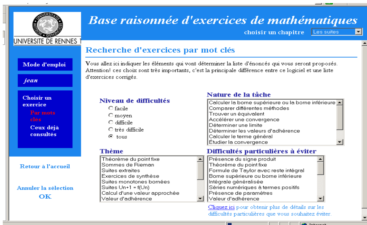
Figure 1 : écran de choix par mots-clés.