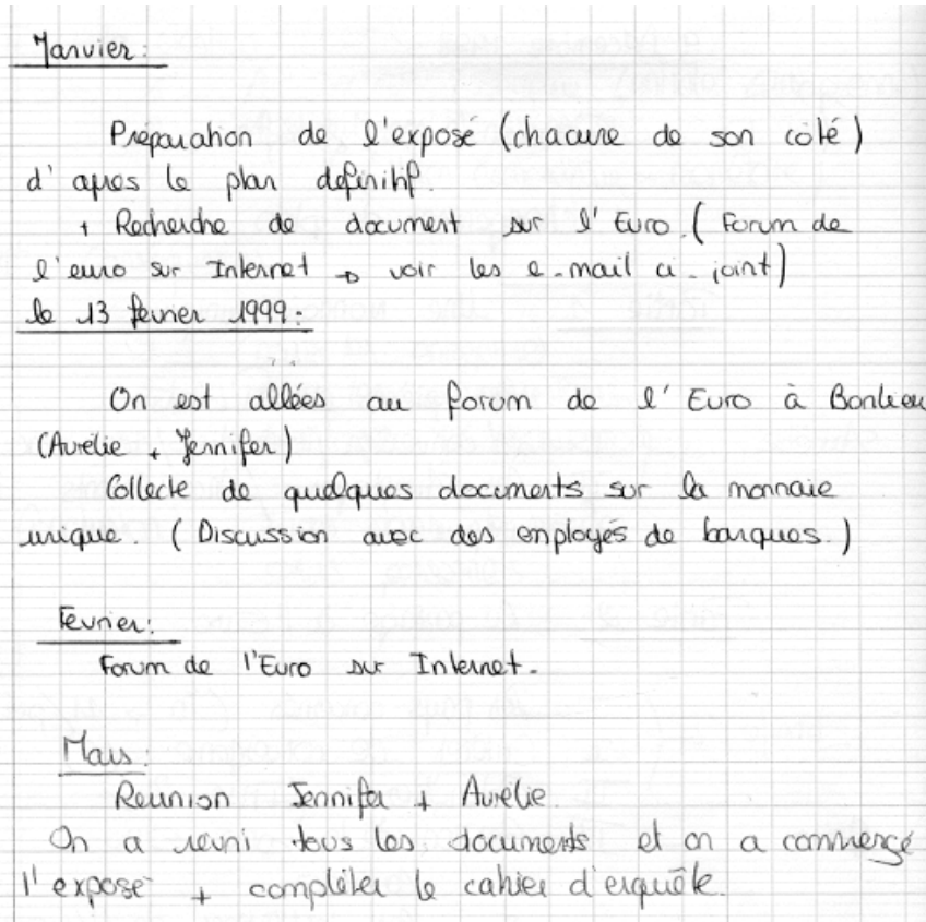
Figure. 1 : Organisation du travail de Claire, Aurélie et Jennifer

Pour vérifier le bon suivi du bornage et faire sauter les blocages qui pouvaient apparaître, j'ai organisé 3 à 4 séquences de travail avec chaque groupe. Ces séquences avaient lieu pendant les heures de modules.