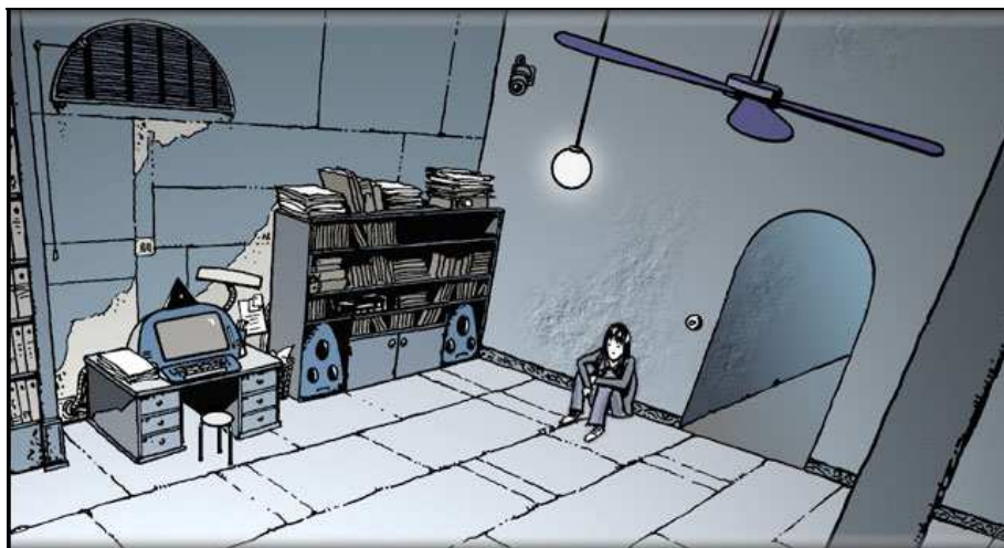
Figure 2 - La chambre de Démo avec son équipement technologique

Ce texte comprend une deuxième partie à lire si le joueur n'arrive pas à passer à la suite ; il indique pour chaque chapitre la marche à suivre (il est pratiquement impossible de poursuivre sans cette aide). C'est également à partir de ce chapitre 3 qu'il faut impérativement passer par l'atelier d'écriture pour accéder au suivant.