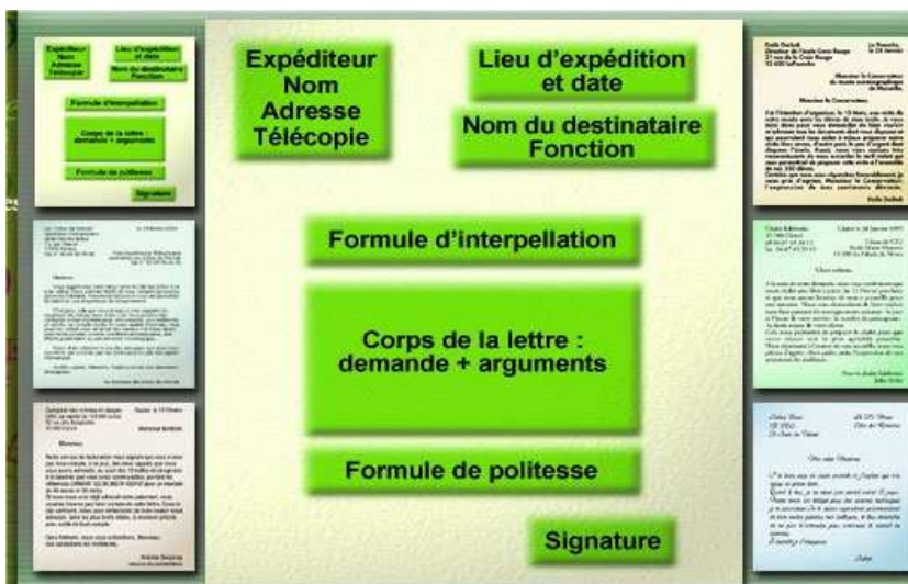
Figure 5 - Modèles de lettres

Après chaque atelier d'écriture, le texte de l'élève est imprimable et il est prudent de faire des sauvegardes régulières !