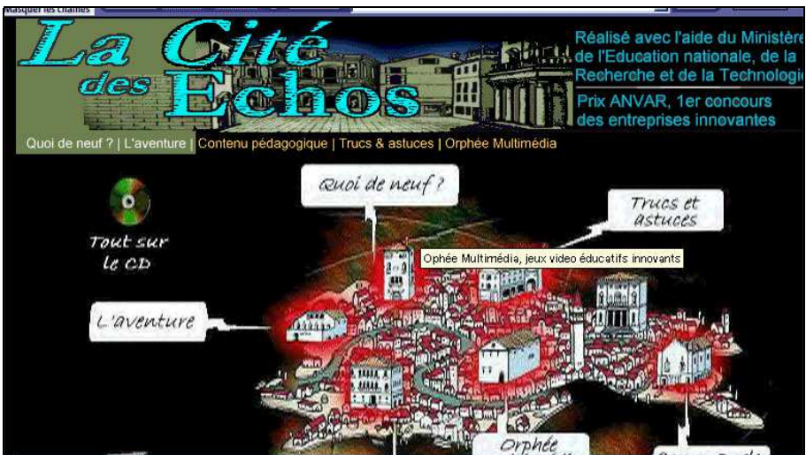
Le site de la cité des Echos