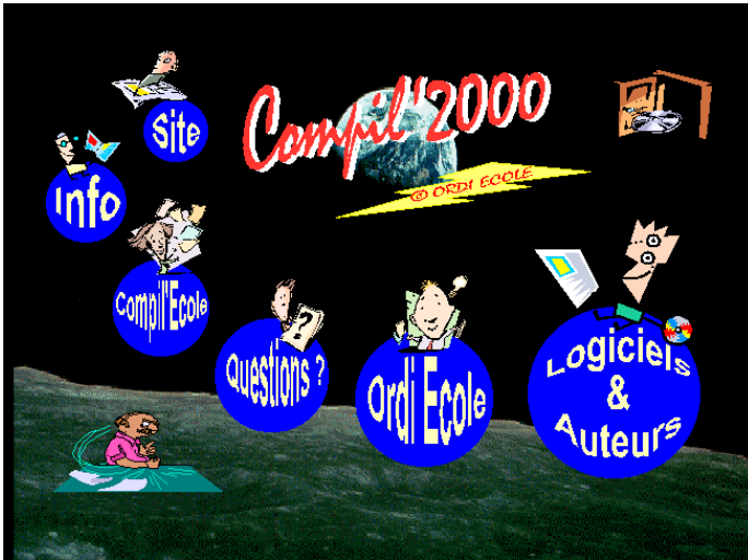
Aides et informations en ligne

Ce produit est accompagné d'un livret papier volumineux mais pratique à consulter et composé de deux parties. La première, après la présentation du cédérom, donne des informations claires et précises, à la portée d'un enseignant même peu expert en informatique, sur la façon de lancer l'interface du cédérom soignée et conviviale. Cette facilité n'a toutefois pas pour vocation « de remplacer une formation de base à l'utilisation de l'ordinateur » comme le rappellent fort à propos les concepteurs. Par contre, au fait des équipements disponibles sur le terrain, ils ont eu la bonne idée de structurer ce cédérom de manière à offrir aux utilisateurs la possibilité d'installer les logiciels destinés à des configurations plus modestes (ou ne possédant pas de lecteur de cédéroms) après une copie sur disquette(s) (à l'exception de quelques logiciels).