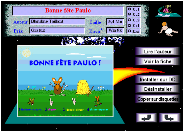
Une installation facilitée par une interface conviviale

L'interface de Compil'2000 est réalisée avec Présente (le logiciel de Jean-Marc Campaner bien connu pour la qualité de ses productions). Elle fonctionne sur tout ordinateur PC ou compatible équipé de Microsoft Windows 3.1* ou Windows 95/98. Quant aux logiciels, leur configuration minimum est spécifiée sur leur fiche.