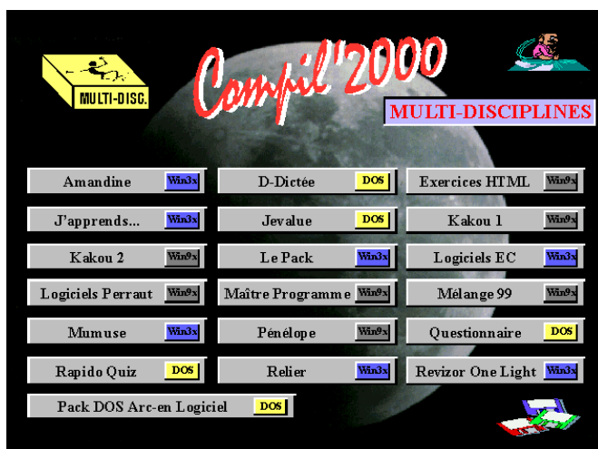
Un des nombreux menus disponibles

Ce cédérom offre une sélection de logiciels pour compatibles PC (de l'obsolète au plus récent) utilisables en classe ou pour la classe. La plupart de ces logiciels sont issus du monde Shareware (Il est à noter qu'un certain nombre de ces produits sont également proposés dans la bourse de diffusion et d'évaluation de l'EPI, voir en pages 205-236 de la présente revue). Ils ont été sélectionnés pour l'intérêt qu'ils présentent dans le cadre scolaire (travail des élèves ou préparation de la classe). Cet intérêt reste relatif, car il prend notamment en compte le prix (pour les shareware) et la configuration requise... La documentation précise d'ailleurs que : « Cette mine de logiciels a pour but de fournir des outils professionnels aux collègues de maternelle, élémentaire et spécialisé, tout en sachant que l'efficacité pédagogique dépend moins de la quantité de logiciels disponibles que de la pertinence de leur usage ».