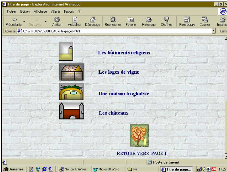
Une page du site