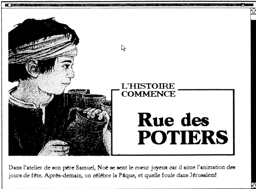
Fig 3. Début d'une "page" réalisée avec Storyteller

Fichier classique de recommandations diverses