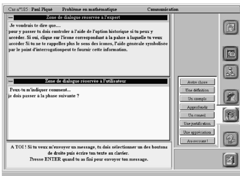
Figure n° 4 : Interface de communication semi-structurée

Une des objections qui peut être faite à ce type d'encadrement à distance de la formation est la disponibilité en temps et en matériel. En effet, pour suivre deux étudiants, il nous faut disposer de quatre ordinateurs (un par étudiant et deux pour le tuteur qui visionne leur travail) et passer devant ces deux postes le temps nécessaire à la tâche qu'ils sont en train d'effectuer. Pendant cette période, le tuteur doit être attentif en permanence aux signaux qu'envoie l'étudiant pour lui demander de répondre à une question, pour réagir à ses actions, pour être capable d'apprécier le contexte dans lequel l'intervention doit se situer... Deux axes d'évolution sont envisageables, l'un technologique, à savoir la possibilité de pouvoir visualiser sur un seul poste les écrans de plusieurs apprenants et d'agrandir la fenêtre de l'écran de celui qui sollicite ou nécessite l'intervention du tuteur, l'autre d'ordre pédagogique à savoir concevoir et utiliser un outil permettant lorsqu'une demande est formulée par l'apprenant au tuteur de prendre immédiatement connaissance d'une série d'informations relatives à sa situation dans le cours, des dernières actions menées,...pour y réagir en tenant compte du contexte d'apparition de la demande. Cette dernière fonctionnalité fournit au tuteur une souplesse plus grande dans la gestion de son encadrement des étudiants tout en ne perdant que peu d'informations relatives au contexte qui a initié la demande d'intervention.