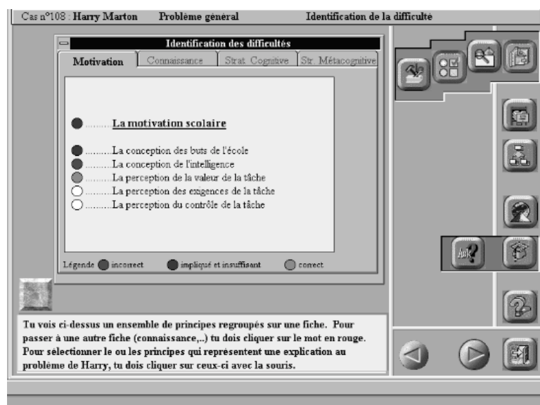
Figure n° 2 : Phase d'identification des difficultés

Au fur et à mesure de l'avancement de l'étudiant à travers les différentes situations d'apprentissage, les exigences évoluent vers un plus grand nombre de principes à retrouver, vers une précision plus fine des fondements théoriques (il faut sélectionner certains principes dans des sous-rubriques qui détaillent des difficultés plus générales) ainsi que vers une plus large variété des fondements théoriques auxquels il est nécessaire de faire appel (le choix des différents principes doit s'opérer sur plusieurs fiches). Comme lors de la première phase, lorsqu'un nombre minimal de principes théoriques a été retrouvé, l'étudiant doit répondre à quelques questions permettant de vérifier sa compréhension des principes sélectionnés ainsi que leurs liens avec la difficulté de départ telle qu'elle a été décrite.