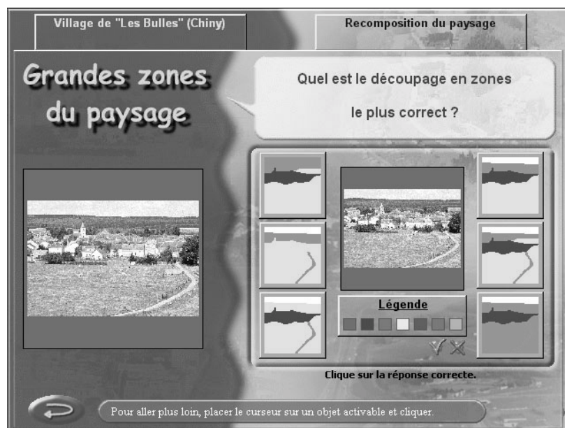
Figure 1 : Ecran d'une activité du logiciel PAYSAGES

L'image en tant qu'objet d'analyse sera prise en compte par l'apprenant pour en tirer les informations qui lui permettront de répondre aux sollicitations du logiciel. Par exemple, au cours d'une des activités proposées par le logiciel PAYSAGES et illustrée par la figure 1, l'apprenant doit analyser un paysage géographique et en déterminer quel en est le découpage en zones le plus adéquat en fonction des conventions utilisées dans ce type d'activités.