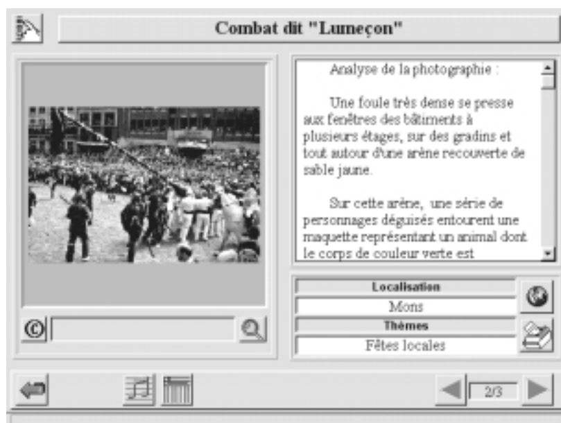
Figure 3 : Ecran du logiciel IMAGES

Si la séquence animée permet de rendre visibles des aspects qui ne le sont pas dans la réalité, les images peuvent aussi être un miroir de la réalité. Bien souvent les images qui jouent ce rôle agissent en complémentarité avec une description textuelle comme dans le logiciel IMAGES (voir figure 3).