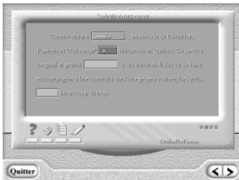
Figure 5 : Ecran du logiciel ORTHOPERFORME

Le son peut également être envisagé en tant que contenu d'apprentissage en association avec un document écrit. Dans le logiciel ORTHOPERFORME, illustré par la figure 5, les apprenants se voient proposer des activités dont l'objectif est l'amélioration de leur orthographe grammaticale. Une manière d'atteindre cet objectif est de fournir aux apprenants des textes lacunaires qu'ils doivent compléter. Lorsque l'apprenant clique sur la zone où se trouve le mot qu'on lui demande d'orthographier, il entend le mot qu'il doit y inscrire. L'utilisation du son permet à l'apprenant de se passer de la présence d'un enseignant qui lui dicte les mots à écrire. Il peut, dès lors, travailler à un rythme qui lui est propre.