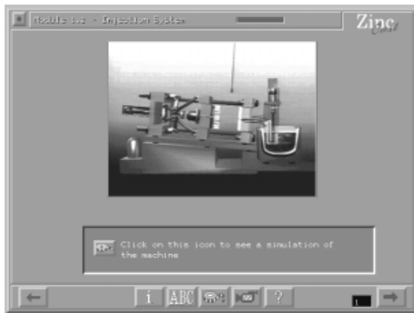
Figure 2 : Ecran du logiciel ZINC-CAST

L'absence de visibilité du processus peut constituer un frein à la compréhension des causes de la production de pièces défectueuses. Si des réglages sont à effectuer pour améliorer la qualité des pièces produites, il est important que l'apprenant comprenne l'effet de ses actions sur le fonctionnement de la machine. L'illustration sous la forme d'une séquence animée constituée d'images de synthèse rend apparents des aspects techniques invisibles habituellement.