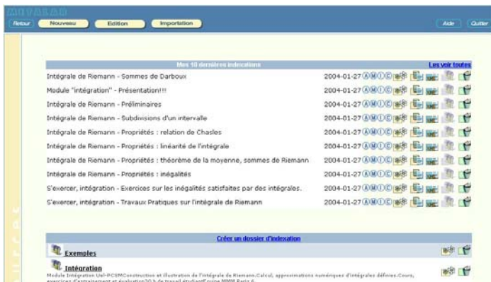
Ecran 1 : Extrait de l'étape auteur