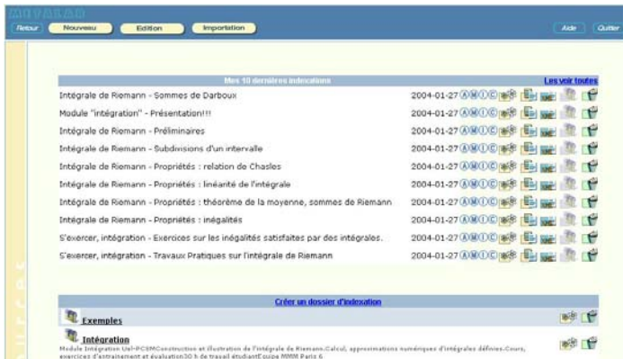
Ecran 1 : Extrait de l'étape auteur

effectué par le centre de production multimédia Ulysse transfert 4 de l'université de Bordeaux 1. Il est réalisé sous Unix/Linux. Il est disponible en ligne et peut bien sûr être utilisé pour indexer des ressources pédagogiques autres que celles de Université en Ligne. En accord avec le bailleur de fonds (le ministère, à travers les appels d'offres sur les campus numériques), l'application est mise à la disposition des utilisateurs potentiels (pour tout besoin d'indexation, quitte à changer le profil d'indexation) aux mêmes conditions qu'UeL, à savoir une utilisation gratuite, sauf quelques cas particuliers.