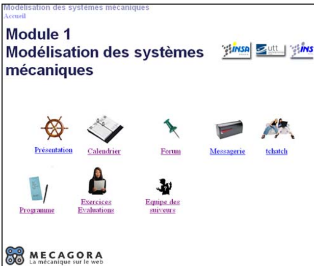
Figure 2 : Ecran d'accueil des étudiants sur WebCT

Les autres composants sont proposés à partir de la plateforme WebCT de Mecagora hébergée par le CNED, cf. figures 2 et 3. Les étudiants y retrouvent une autre partie du contenu, des exercices d'entraînement et d'évaluation, rangés par thèmes et détaillés plus loin, ainsi que les outils de communication et de tutorat (messagerie, tchatch, forum) et de planification de la formation (calendrier).