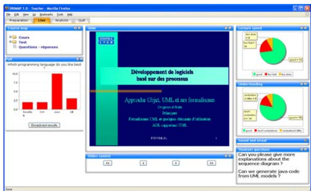
Figure 2 – Interface utilisateur de l'enseignant