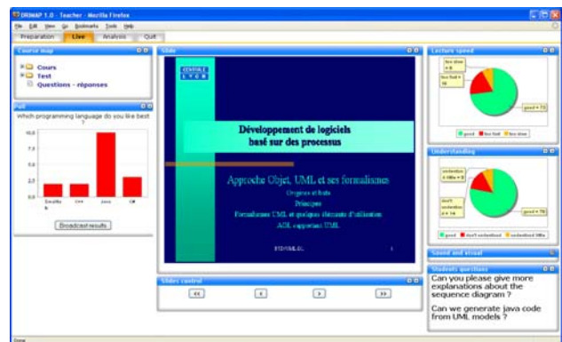
Figure 2 – Interface utilisateur de l'enseignant