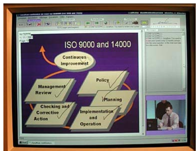
FIG. 4 – Virtual Learning Environment (inclusion vidéo)