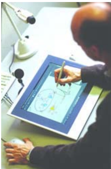
FIG. 1 – La position professeur dans le dispositif TuttelNet®

[13] VirTEPPE. Virteppe learning environment. http://www.virteppe.net/ , November 2001.