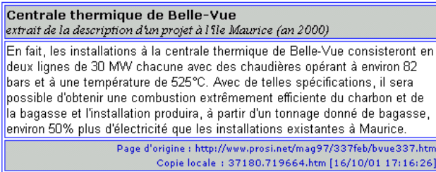
Figure 3 : Un extrait avec titre et commentaire en partie supérieure, contenu du fragment prélevé sur le document d'origine en partie médiane, références et date de la copie en partie inférieure

Les dossiers personnels de notes sont structurés dans une hiérarchie de sous-dossiers et d'extraits. Cette structuration permet de considérer chaque sous-dossier comme un dossier de notes indépendant, notamment pour l'édition et la sauvegarde.