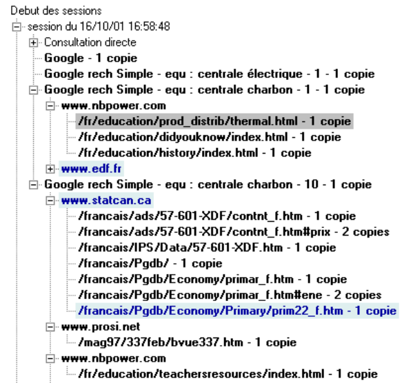
Figure 4 : Partie d'historique montrant quelques recherches et sites visités (les éléments marqués sont surlignés en clair, l'élément sélectionné est surligné en foncé)

Dès la phase de navigation, l'utilisateur peut opérer une sélection sur l'historique en marquant les documents qu'il juge pertinents ou en masquant ceux qui ne présentent pas d'intérêt. Marquage et masquage n'affectent que la présentation de l'historique mais n'ont pas d'effet sur les données enregistrées, ce qui permet de reconstituer ultérieurement la totalité de la recherche, en mode administrateur.