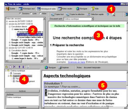
Figure 5 : La fenêtre de prise de notes : 1 barre de commandes, 2 historique, 3 lecture des pages, 4 éditeur de plan de notes, 5 visionneur de notes ou éditeur de fragments

L'interface de prise de notes comporte cinq zones de travail : une barre de commandes, l'historique, le lecteur de pages, l'éditeur de plan de notes, et l'éditeur de fragments.