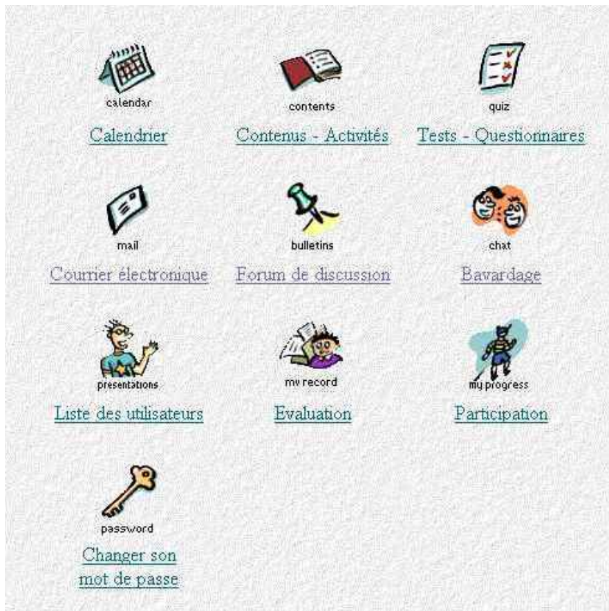
Figure 1 : les outils de l'environnement WebCT