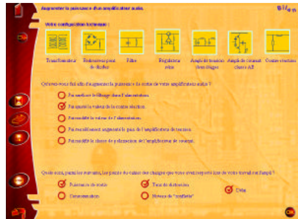
figure 4 - écran « Bilan de mission »

Dans cette perspective, plusieurs éléments sont ici à noter. Tout d'abord, afin de rendre plus crédible notre scénarisation, nous avons travaillé son expression graphique (la mission et le cahier des charges sont par exemple présentés sous forme de fiches « trombonnées », cf figure 3). Ensuite, nous avons tenu à ce que l'engagement affectif et cognitif de l'élève lié à la mission ne « disparaisse » pas au cours de son activité. C'est la raison pour laquelle, à la fin de son activité au sein du simulateur, l'élève doit réaliser un bilan de sa mission. Ce bilan a l'avantage de susciter chez lui une réflexion ou une évaluation – méta-cognitive – riche sur l'action menée (Linard 1998). Précisément, s'effectuant dans un écran spécifique (cf. figure 4), ce bilan procède, en quelque sorte, d'une co-réalisation dans la mesure :