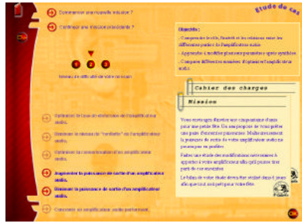
figure 3 – écran « Choix mission »

Afin d'illustrer plus concrètement notre propos, nous avons choisi de présenter le travail de conception effectué sur deux écrans liés à la mission. Il témoigne de notre souci d'affranchir notre simulateur pédagogique du modèle du simulateur scientifique (cf. 2.1.1), et de le centrer résolument sur l'activité de l'élève.