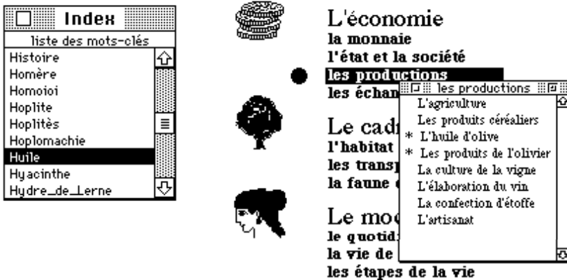
Fig. 2 - Aide à la localisation d'informations

Si l'on reprend l'exemple précédent, on imagine aisément que tout ou partie d'une sélection réalisée à l'aide du double dispositif « index + table des matières » se concrétise en un réseau de navigation entre ces rubriques. Nous développons actuellement la maquette d'un système dans lequel l'utilisateur peut créer un certain nombre de registres (carnets) dans lequel il range ses diverses sélections et qui représentent autant de réseaux de navigation spécifiques dans lesquels il peut naviguer à sa guise 4 . Ces réseaux sont modifiables à volonté (ajouts ou suppression de noeuds).