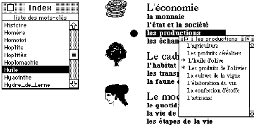
Fig. 2 - Aide à la localisation d'informations

Si l'on reprend l'exemple précédent, on imagine aisément que tout ou partie d'une sélection réalisée à l'aide du double dispositif « index + table des matières » se concrétise en un réseau de navigation entre ces rubriques. Nous développons actuellement la maquette d'un système dans lequel l'utilisateur peut créer un certain nombre de registres (carnets) dans lequel il range ses diverses sélections et qui représentent autant de réseaux de navigation spécifiques dans lesquels il peut naviguer à sa guise 4 . Ces réseaux sont modifiables à volonté (ajouts ou suppression de noeuds).