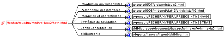
Figure 2. Les adresses des pages Web avant le renommage des nœuds.

Dans le système HyWebMap, nous avons introduit le concept de renommage des nœuds et des liens entre des nœuds pour que l'utilisateur rende son réseau compréhensible. Il peut nommer les liens entre les nœuds en fonction de ses connaissances sur le contenu de ces pages. Ce mode de construction du réseau virtuel favorise chez l'utilisateur une navigation plus réflexive et planifiée. La figure 2 présente les adresses des pages Web avant le renommage des nœuds par l'utilisateur.