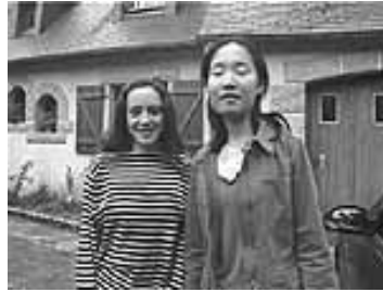
Figures 6 & 7. Les Hongkongaises.