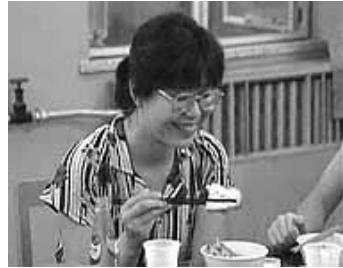
Figures 4 & 5. Zouba!

En Australie, où la population est pour la plupart d'origine européenne, on commence seulement aujourd'hui à comprendre que nous sommes situés en Asie. En conséquence, le chinois et le japonais deviennent des langues de plus en plus importantes. En 1990, j'ai tourné une série de documents vidéos sur 8 jeunes Australiens qui faisaient leurs études en Chine. Leurs difficultés étaient plus souvent d'ordre culturel que linguistique.