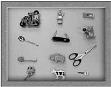
Figure 1. Test de mémoire visuelle.

En 1986, la psychologue Judith Kearins publiait une expérience dans laquelle elle soumettait des enfants à un « test de mémoire spatiale » (Kearins, 1986), figure 2. Les objets employés dans ce test (des roches, des feuilles, des brindilles) étaient arrangés sur un plateau. Les enfants les observaient pendant 30 secondes puis on changeait la place de ces objets. On demandait ensuite aux enfants de replacer ces objets à leur place d'origine. La performance des enfants aborigènes pour ce test était cette fois bien meilleure que celle des enfants d'origine européenne.