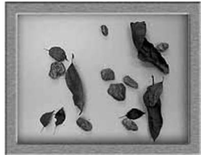
Figure 2. Test de mémoire spatiale.

Kearins suggère que cette différence dans les résultats vient du fait que l'idée de propriété privée n'est guère développée dans le système de valeurs des aborigènes australiens. En conséquence, la mémorisation des noms des objets est pour eux moins importante que pour les Européens. Par contre, l'observation et la mémorisation des relations spatiales dans un univers désertique sont des qualités essentielles pour le repérage et l'appréhension des directions.