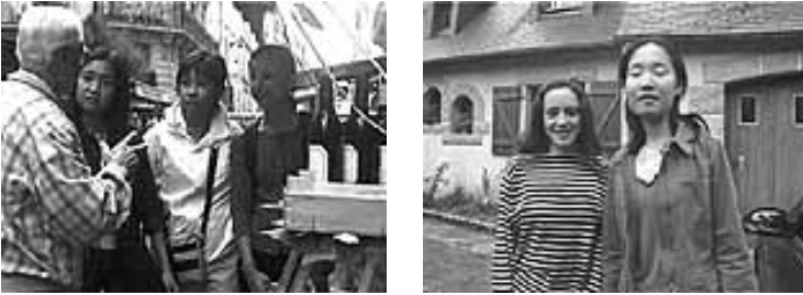
Figures 6 & 7. Les Hongkongaises .