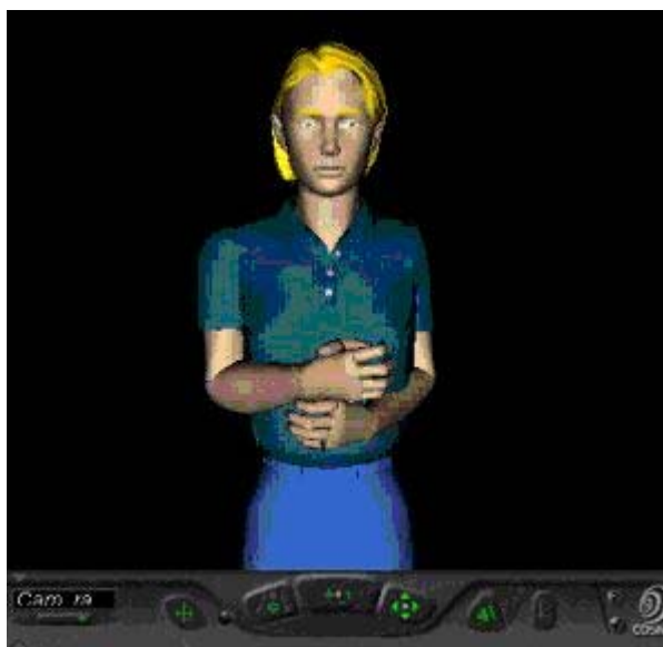
Figure 1 : signeur Virtuel ( Losson00 ).

Losson ( Losson00 ) a en revanche réussi à créer un signeur virtuel à base d'images de synthèse ( Figure 1 ) permettant de visualiser en LSF des phrases pré-formatées en "français-signé". Le français-signé est un système gestuel servant d'intermédiaire entre la langue parlée et la LSF : chaque mot de la langue française est signé par son équivalent en LSF, une traduction "mot à signe" en quelque sorte. Le système de Losson ne traduit donc pas du français en LSF, mais signe en LSF des séquences du type : {MOI} {MANGE} {POMME}. La contrainte du système est de définir au préalable l'ensemble de mots "signables" à travers toutes les composantes du signe : configuration, emplacement et orientation au début et à la fin du geste, mouvement du geste lui-même, expression du visage. Son intérêt réside dans la qualité des séquences signées obtenues.